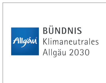
Logo Bündnis klimaneutrales Allgäu 2030