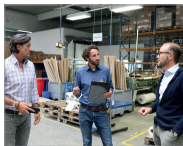
Beratungen zur Reduktion sind ein Kernelement im Bündnis. Hier bei der Firma Topp Textil in Durach.

Der Schwerpunkt liegt zunächst auf der Reduktion der eigenen CO 2 -Emissionen durch mehr Energieeffizienz und den stärkeren Einsatz von erneuerbaren Energien vor Ort. Unvermeidbare Restemissionen werden durch die Förderung hochwertiger Projekte zur CO 2 -Einsparung in der Region, aber auch im Ausland kompensiert.